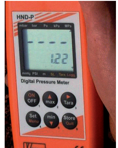
Auftriebsmessung zur Bestimmung des optimalen Ziehzeitpunktes der Verbaubox und der RSS Rohrverlegehilfe