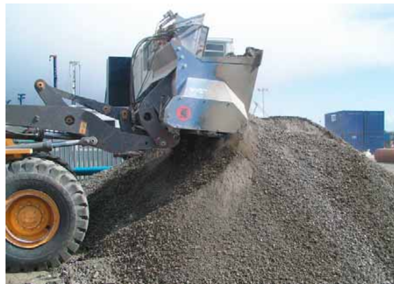
Mit der richtigen Technik wird jeder Boden beherrschbar