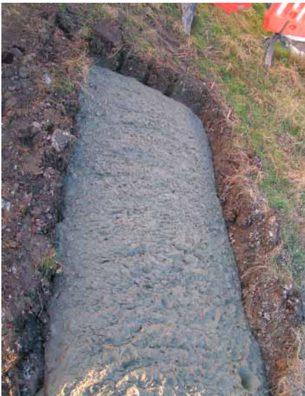
Der erste englische Flüssigboden ist im Graben und schon kurze Zeit später belastbar.