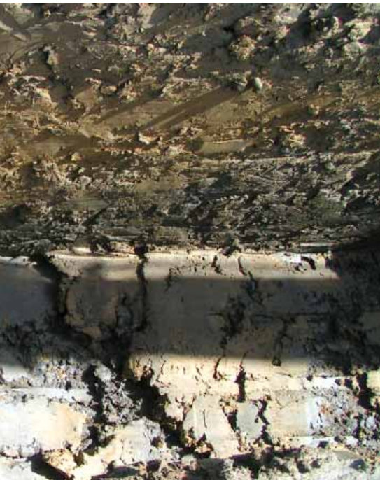
Aushub im Graben mit einem Profil durch die vom Baggerlöffel geschnittenen Tonschichten.