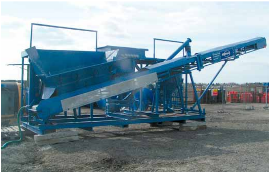
RSS Kompaktanlage, schnell aufgebaut und funktionstüchtig.

Die Lage der Insel führt zwangsläufig auch dazu, dass es sich bei den Wassereinflüssen in den vorgefundenen Untergründen nicht nur um Süßwasser handelt. Der Einfluss von Salzwasser verursacht zusätzliche Schwierigkeiten bei der Beherrschung solcher Böden, da die Einlagerungen an Salzen, die unter Wassereinwirkung auch wieder ausgespült werden können, die Standfestigkeit stark beeinträchtigen.