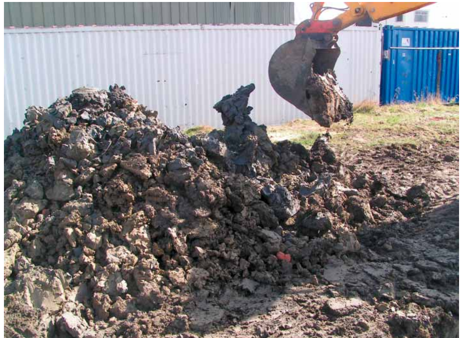
Toniger Aushubboden mit fossilen und huminen Einlagerungen.

bauen zu können. Diese, sozusagen angelsächsisch-sächsische Zusammenarbeit war letztendlich erfolgreich.