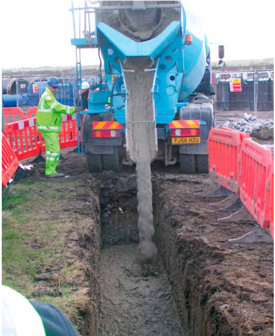
Englische Kollegen verfüllen den Graben bis zur Grasnabe mit RSS Flüssigboden

Diese und weitere fachplanerischen Vorbereitungen wurden in einem so genannten „Method Statement“ zusammengefasst, das der ausführenden Firma, ergänzend zur normalen Planung, zur Verfügung stand. Mit dieser Vorarbeit, welche die normale Planung und damit Ausschreibung ergänzte, wurde die Baufirma in die Lage versetzt, trotz Erstanwendung die technischen und wirtschaftlichen Vorteile des Flüssigboden-Verfahrens problemlos zu erkennen und in ihrer praktischen Arbeit durch eine optimale Verfahrensumsetzung zu nutzen. Natürlich drückt sich eine solche Vorbereitung auch in den für den Auftraggeber und Bauherrn dann schnell spürbaren Kostenvorteilen aus. Die Kostenreduzierungen werden mit solch einer ergänzenden planerischen Vorarbeit schneller und sicherer erkannt und damit erst nutzbar. Angstzuschläge infolge unklarer Vorgaben der ebenfalls noch unerfahrenen Beteiligten entfallen. So konnte das