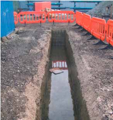
Wasser im Graben – für RSS Flüssigboden kein Problem