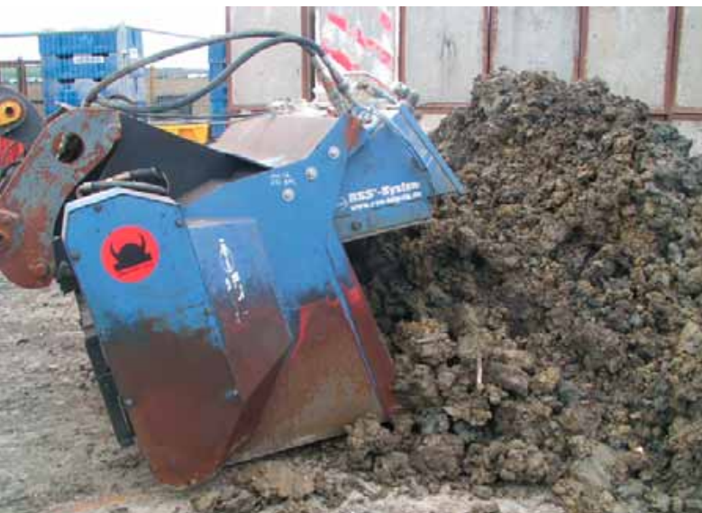
SkanCraft- Schaufelseperator und RSS-Dosiereinheit, eine untrennbare Einheit für hohe Leistungen bei der Verarbeitung schwieriger Böden.